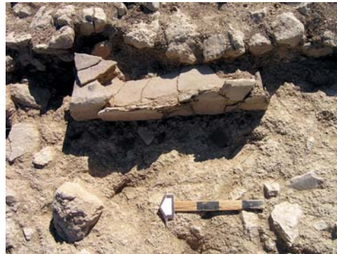
Εικ. 5. Ταφικό Κτήριο 2. Δωμάτιο 3, λάρνακα από Δ.