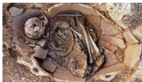
Εικ. 3. Ταφικό Κτήριο 2. Δωμάτιο 1: 1) ταφικός πίθος και λάρνακα από Β, 2) ταφικός πίθος και λάρνακα από Δ.