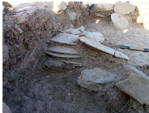
Εικ. 6. Ταφικό Κτήριο 2. Δωμάτιο 7, αποθηκευμένα πινάκια από Α.