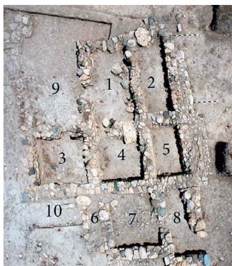
Εικ. 2. Ταφικό Κτήριο 2, αεροφωτογραφία.