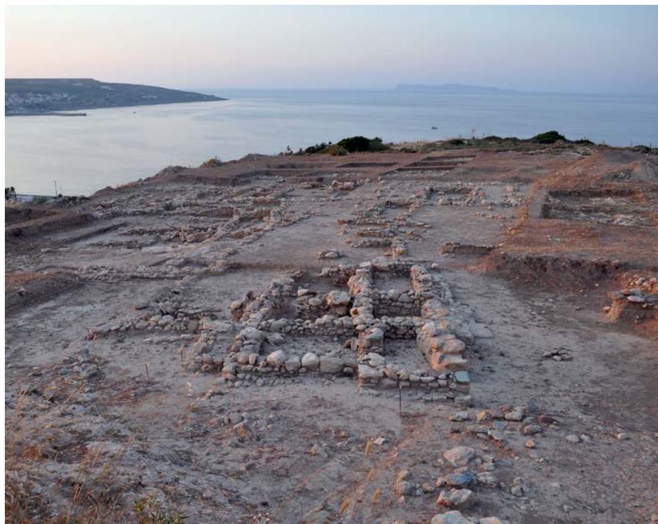
Εικ. 1. Νεκροταφείο Πετρά 2011, από Ν.