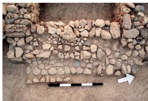
Εικ. 7. Ταφικό Κτήριο 2. Ανατολική πλευρά, κλιμακωτή πλατφόρμα από Α.