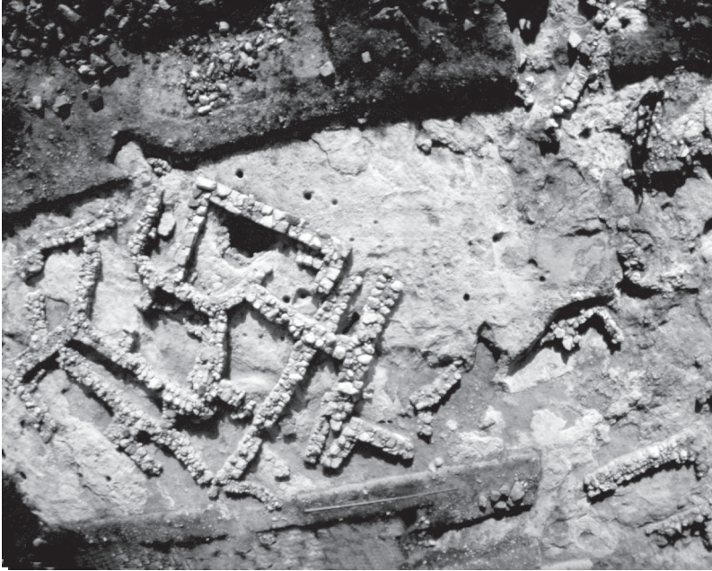
Εικόνα 2 : Αεροφωτογραφία της ανασκαφής στην Κεφάλα Πετρά