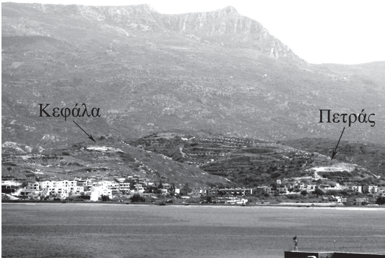
Εικόνα 1 : Άποψη της Κεφάλιας και του Πετρά από βορειοδυτικά

του Πετρά, όπου μετακόμισε ο πληθυσμός στην ΠΜ ΙΙ περίοδο. Με βάση αυτό το δεδομένο φαίνεται πολύ πιθανό ότι η προστασία από εξωτερικούς κινδύνους αποτελούσε μια σημαντική παράμετρο στην επιλογή της θέσης, σε συνδυασμό με το γεγονός ότι ελέγχει οπτικά ολόκληρο τον κόλπο της Σητείας, καθώς και μεγάλο μέρος της εύφορης πεδιάδας του ποταμού Παντέλη, ο οποίος παρείχε το απαιτούμενο πόσιμο νερό σε κοντινή απόσταση από τον οικισμό.